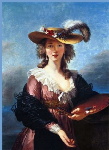
Élisabeth Vigée Lebrun

Je suis une femme issue de petite bourgeoisie. J'ai trouvé place au milieu des grands royaumes et surtout auprès du Roi et de sa famille. Toute ma vie, j'ai été favorable au Roi, ce qui fait de moi une monarchiste. Pendant la révolution, j'ai dû quitter mon pays à cause des révolutionnaires dangereux. Je suis partie dans la nuit du 5 au 6 octobre 1789 accompagnée de ma fille et je suis revenue en 1809 après la révolution, toujours favorable au Roi. Dans ma vie, je me suis retrouvée plusieurs fois confrontée à des difficultés : par rapport à mon rôle de femme dans la société ou encore le fait que je sois une monarchiste. Malgré tout, j'ai tout de même eu plusieurs réussites comme mon œuvre sur Marie-Antoinette et mon entrée à l'Académie Royale de la peinture et de la sculpture.